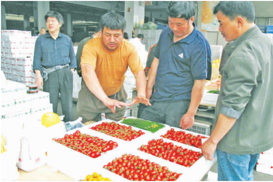
水果市场行情近来一路攀升,南京农副产品中心南北水果相继入市,交易活跃,每日成交数万吨各类瓜果。图为来自南方的新鲜应市水果吸引了批发商前来选购。

同样的问题也出现在猪肉生产上。连平告诉记者,前期猪肉价格持续下跌,导致养殖户宰杀部分能繁母猪,未来生猪供应减少,“猪周期”再现,加上玉米等养猪饲料价格上涨,可能推动下半年至明年猪价大幅上涨。 商才